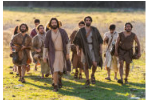
Bilder aus der Serie „The Chosen“