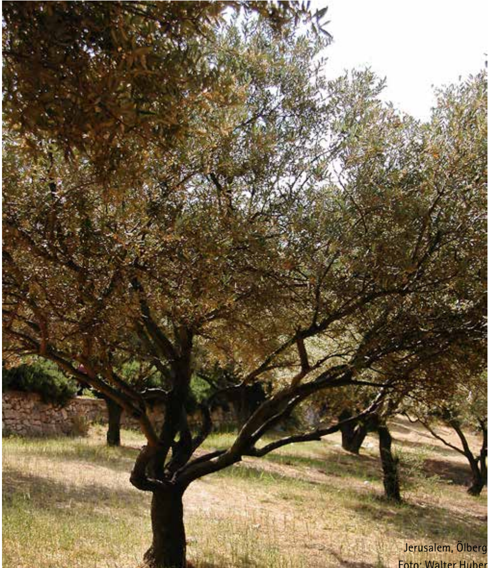
Jerusalem, Ölberg